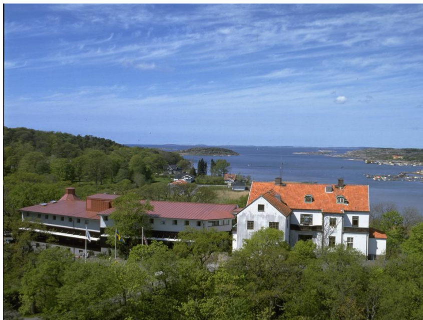
NDC - Netzler & Dahlgren Co AB - på Särö.