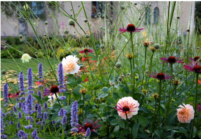
Solhattar, rosor, anisisop och rörlika tumlar om varandra och över hela härligheten svävar jättevädden på höga skira stjälkar.

– Jag var aktiv i kyrkan som väldigt ung, så det är inte som om jag plötsligt blivit religiös. Det var bara en del av mig som jag lagt åt sidan för en tid. Men det är nog omöjligt att arbeta med utformningen av en sådan här plats utan att det sätter i gång tankarna kring skapelsen, meningen med livet och döden så klart, berättar hon.