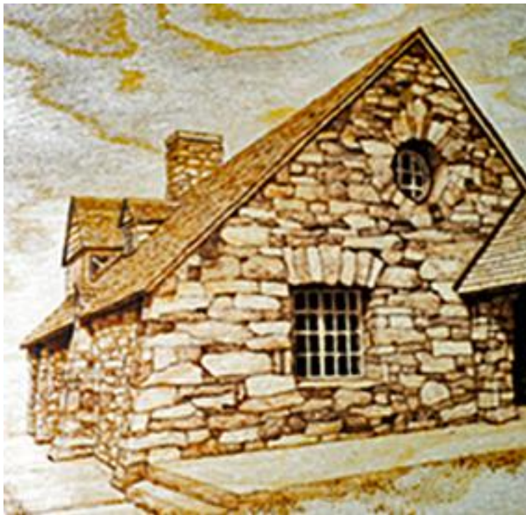
Ett exempel på en glödritning - från en instruktion på internet.