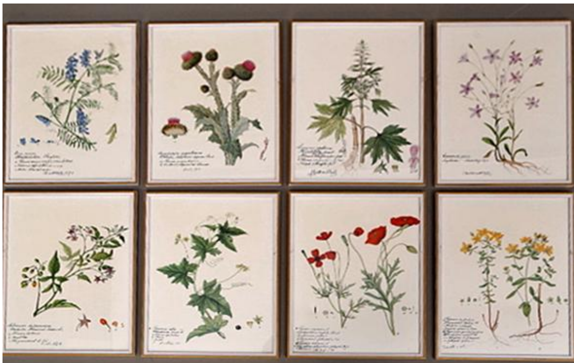
De tryckta bilderna ur mappen utgiven 1985.